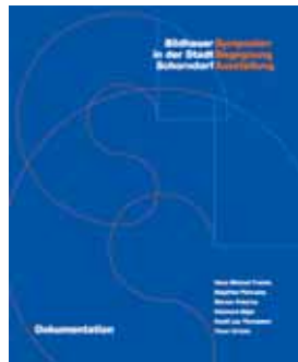
Bildhauersymposium Schorndorf 97, Herausgeber: Kulturforum Schorndorf, Verlag Carl Bacher, Schorndorf 1997, ISBN 3-924431-29-7