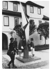
Bildhauer- symposium, 87

Ihr erster Eindruck? Übt die Skulptur mit ihrer Formensprache, ihrer Farbigkeit und ihrem Material eine sinnliche Ausstrahlung auf sie aus? Achten Sie jetzt auf Details, auf Formelemente wie Kuben, Flächen, Winkel, Kanten, Schnitte, Rundungen, Gewölbe. Gibt es plastische Akzentsetzungen, Spannungsbögen, Konzentrationspunkte? Sie können die Skulptur gerne ‚be-greifen‘, denn mit dem haptischen Erlebnis fällt das Begreifen leichter.