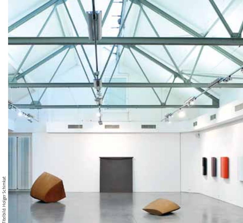
Titelbild: Holger Schimkat